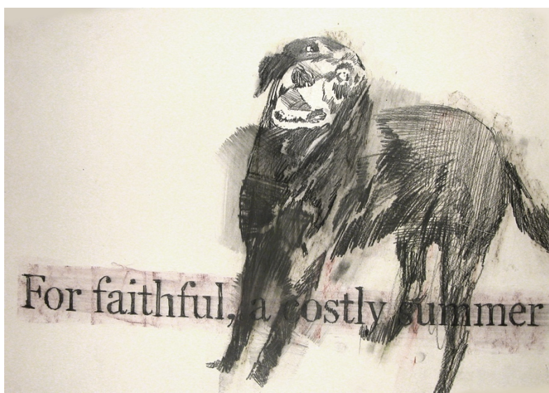
Victor Kastelic, Cloudburst, "Black Dog Headlines N°1", 2002, svinčnik na papirju, 40x60 cm. © The Artist